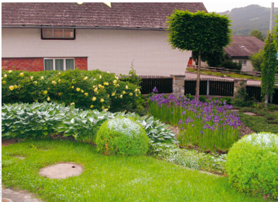
Une variété d'espèces est à privilégier dans un jardin paysager.

guerre à nos administrés. Nous préférons prendre acte et tirer les conséquences pour faire mieux par la suite.