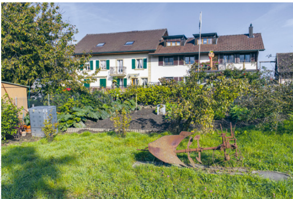
Des jardins potagers à Noréaz.

pas seulement dans les nouvelles constructions. Une ferme a été rénovée, avec l'ajout d'un étage. Auparavant, elle était entourée d'une surface perméable, pré, végétation, etc. Aujourd'hui, tout le pourtour est goudronné. Dans un autre quartier, le propriétaire d'une maison jumelée a remplacé les pavés de sa place de parc par du goudron.